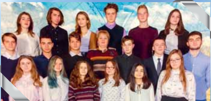
11 «а» – школа № 184