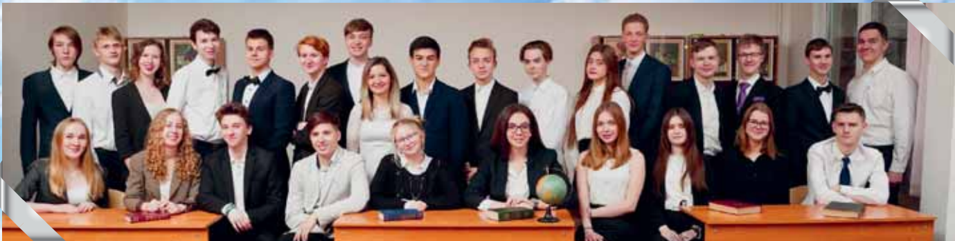
11 «а» – школа № 156

Я очередной школьник очередного поколения детей очередного одиннадцатого класса, но с большими планами на будущее. Являясь ребенком XXI века, было грехом для меня не связать свою жизнь с технологиями. После успешного обучения я стану программистом. Я вижу свои перспективы в России в продвижении цифровизации и автоматизации всего. С помощью машинного обучения я с набором нулей и единиц научу машину чему угодно! В идеале мое направление должно сократить количество людей, которые занимаются неблагодарным или опасным трудом. Так, заменив худшие и опаснейшие профессии, я смогу спасти чьи-то жизни и перенаправить людей на более творческие и оплачиваемые работы. Мечтать не вредно, но все равно хочется быть полезным обществу, чтобы вернуть долг Родине за то, что меня воспитала.