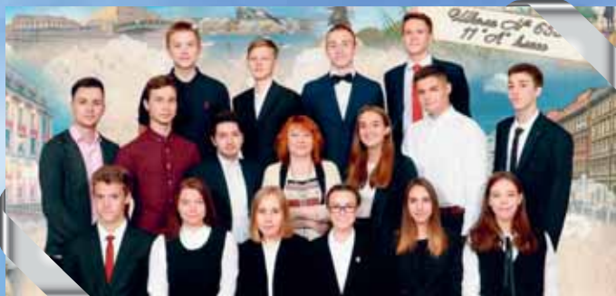
11 «а» – школа № 653