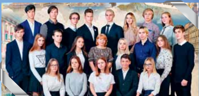
11 «а» – школа № 192