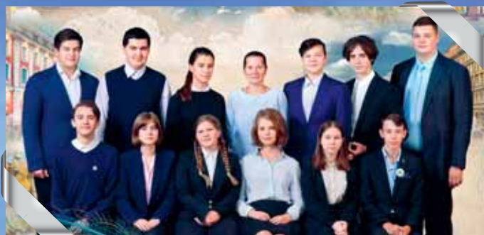
11 «б» – школа № 192